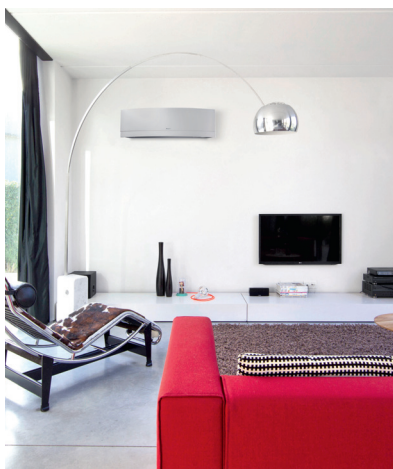
Nagroda za Najciekawszy produkt 2014 przyznana na forum Wentylacja Salon Klimatyzacja 2014

● 2-obszarowy czujnik inteligentne oko: steruje komfortem na dwa sposoby; jeżeli pomieszczenie jest puste przez 20 minut, zmienia nastawę i rozpoczyna oszczędzanie energii; jak tylko ktoś wejdzie do pomieszczenia, natychmiast powraca do oryginalnego ustawienia; czujnik inteligentne oko kieruje także strumień powietrza z dala od osób znajdujących się w pomieszczeniu, aby uniknąć zimnych przeciągów.